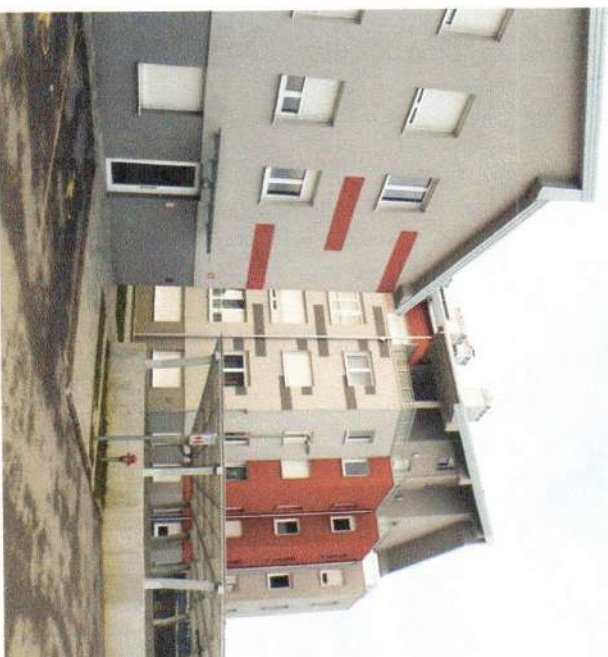
Pri Unionu 39, 40 in 41

Temeljna naloga upravnika in vzdrževalca objekta je ohranjanje vrednosti objekta ter zagotavljanje primarnega bivalnega oziroma delovnega okolja etažnim lastnikom, upoštevajoč vse zakonske predpise in standarde ter navodila stroke s tega področja.