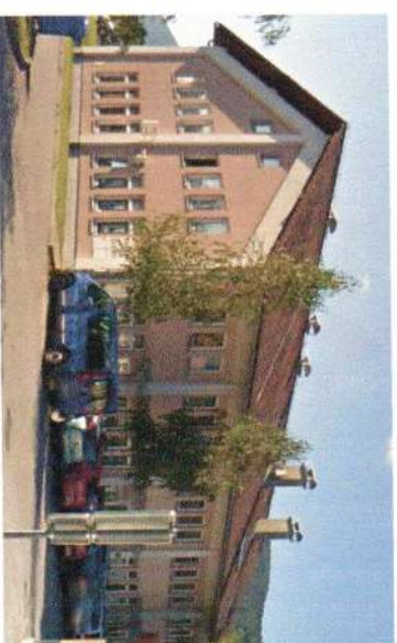
Podjetniško naselje Kočevje 1

Na Kočevskem in Ribniškem imamo v upravljanju več kot 20 večstanovanjskih in poslovnih stavb.